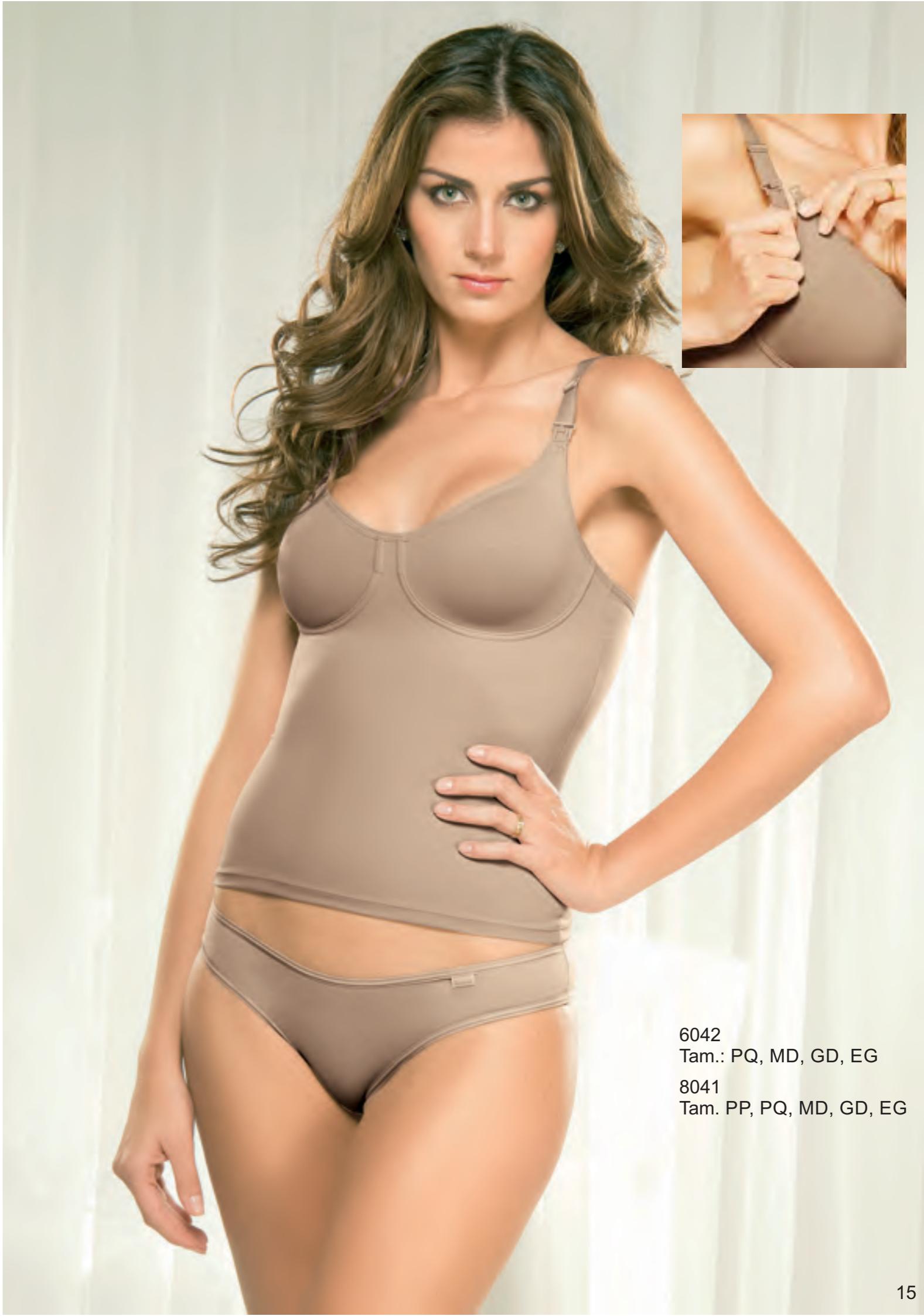
6042 Tam.: PQ, MD, GD, EG 8041 Tam. PP, PQ, MD, GD, EG