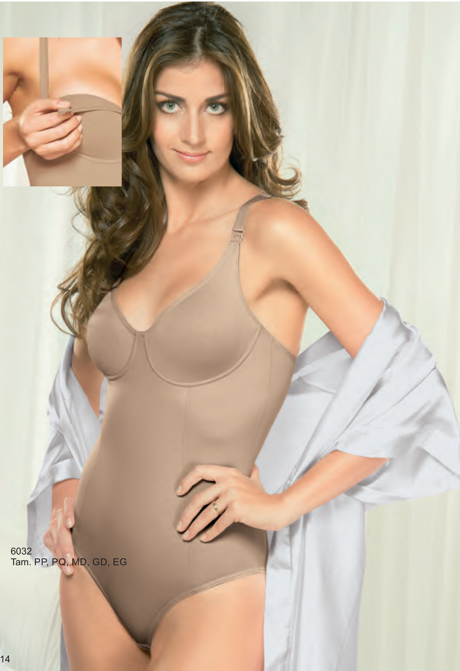
6032 Tam. PP, PQ, MD, GD, EG