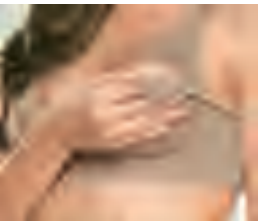
530 Tam.: 36, 38, 40, 42, 44, 46, 48