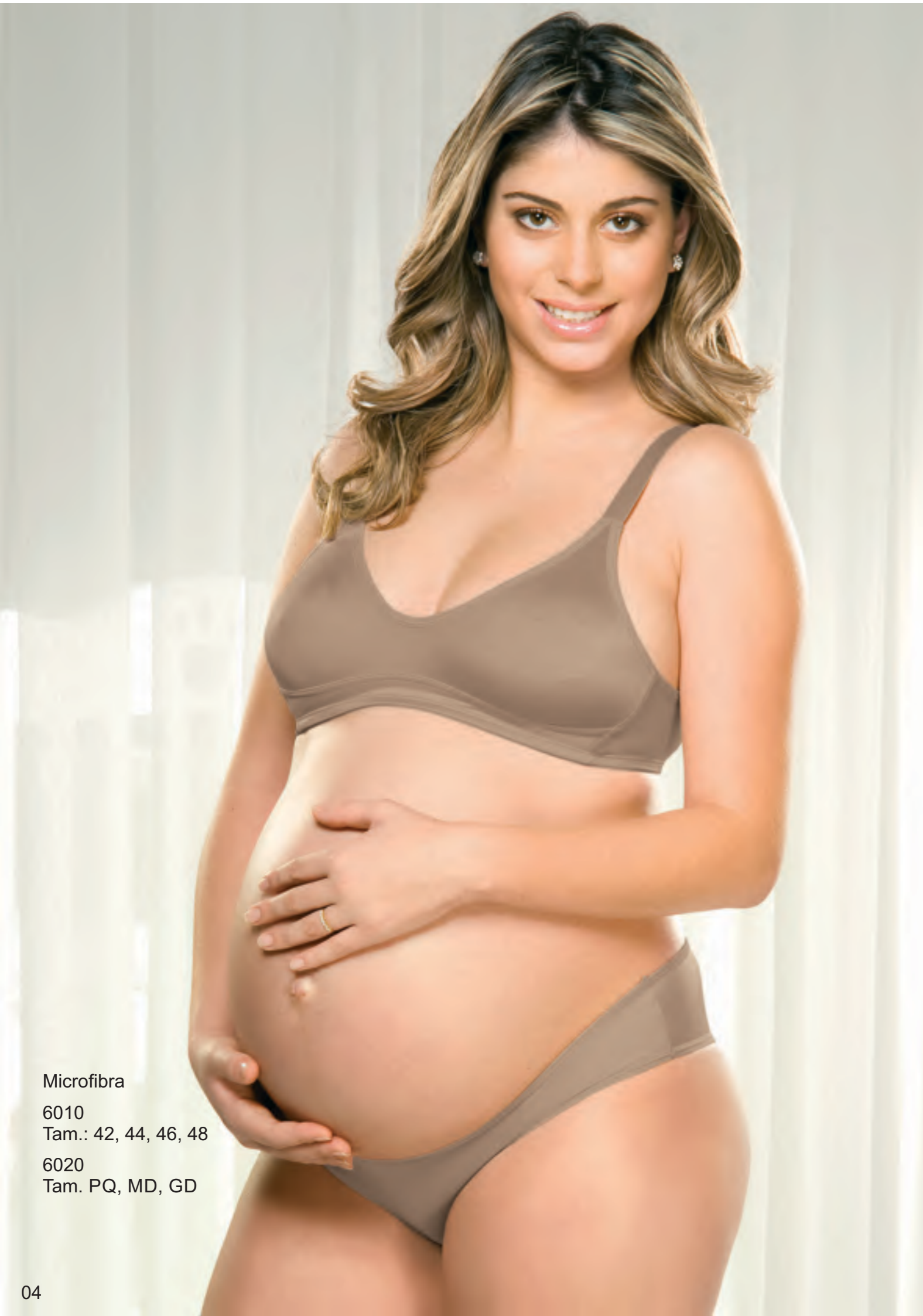
Microfibra 6010 Tam.: 42, 44, 46, 48 6020 Tam. PQ, MD, GD