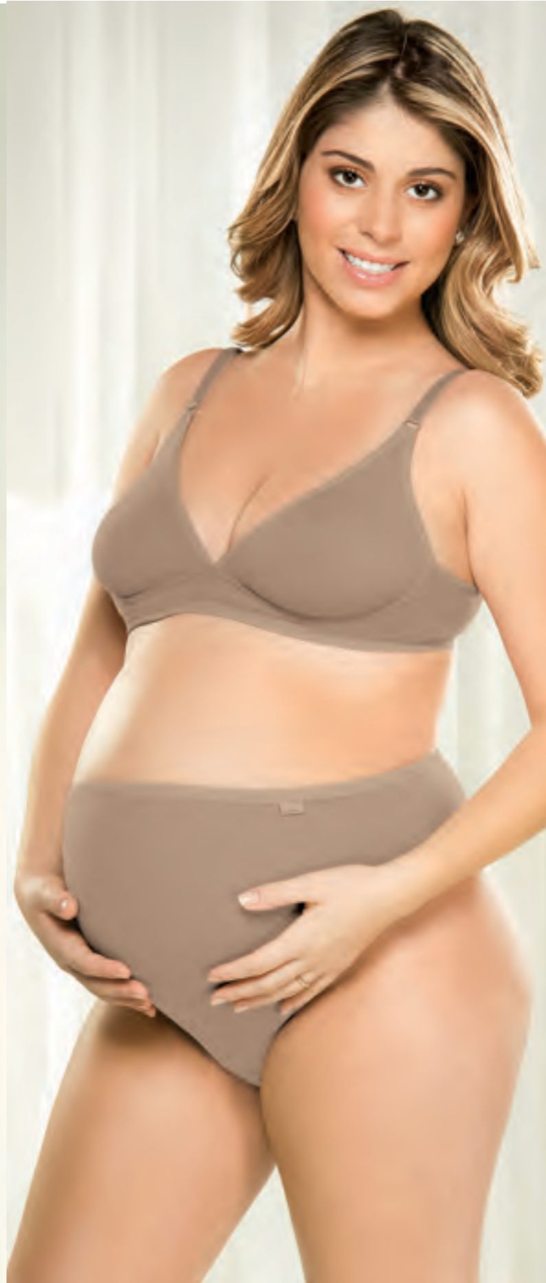
Cotton 330 Tam.: PQ, MD, GD, EG 730 Tam.: PQ, MD, GD, EG