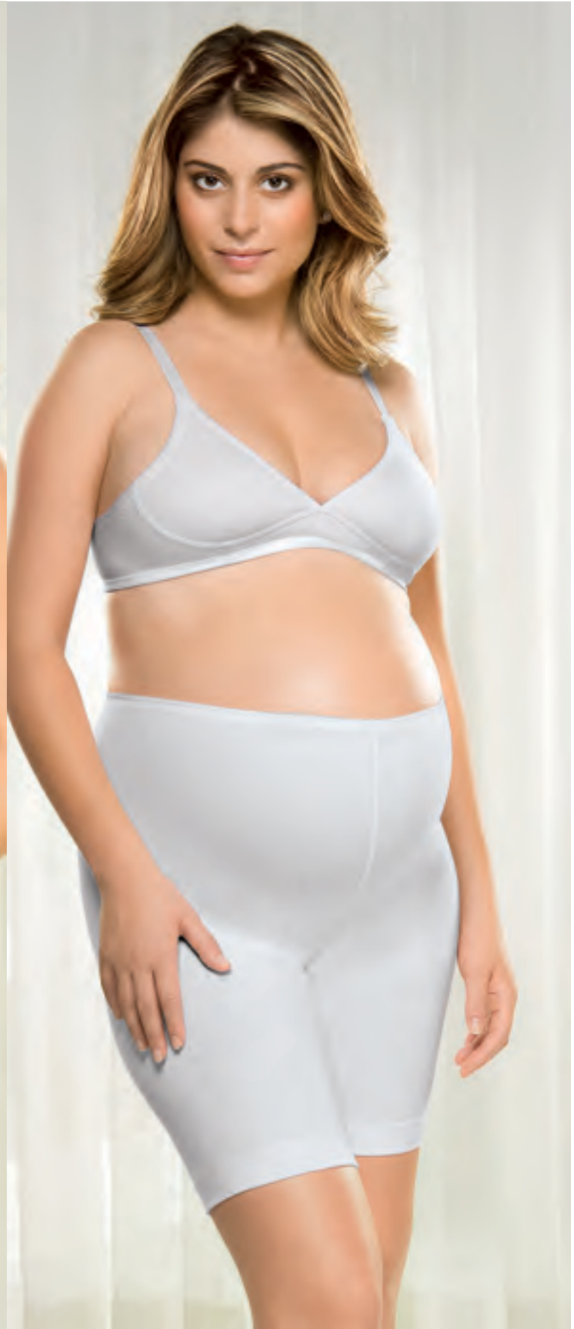
Cotton 331 Tam.: PQ, MD, GD, EG 532 Tam.: PQ, MD, GD, EG