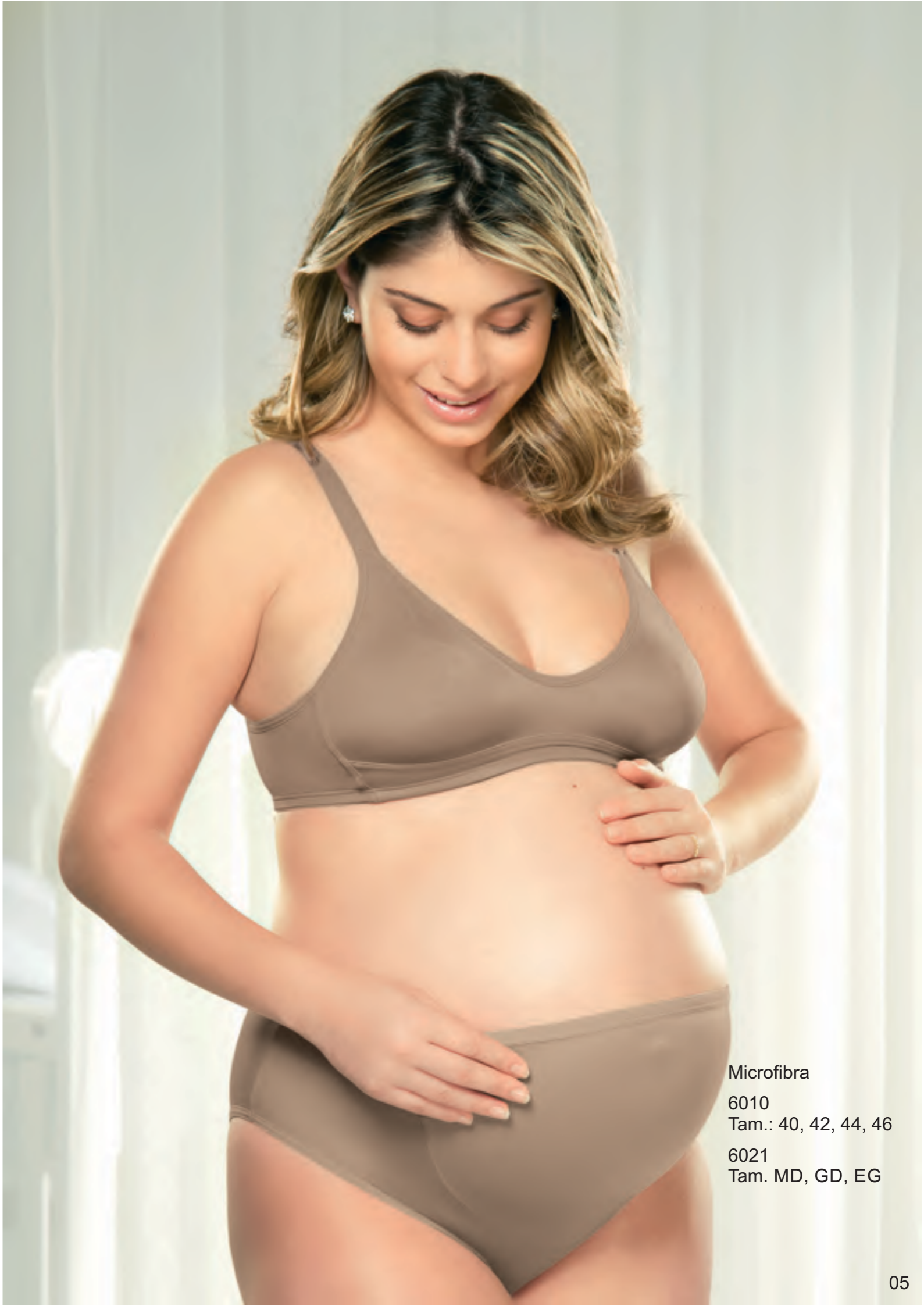
Microfibra 6010 Tam.: 40, 42, 44, 46 6021 Tam. MD, GD, EG